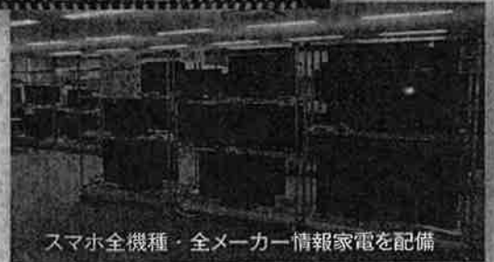
スマホ全機種・全メーカー情報家電を配備